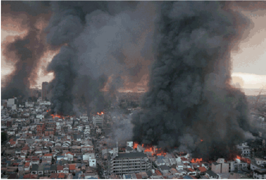
阪神・淡路大震災。炎上する神戸市の 長田区付近。 1995年1月17日。