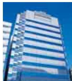
中四国 新センタビル

2007年1月、中四国地区のアウトソーシング拡大に対応するため、センタインフラを一新いたしました。最新鋭の装置を設置し、セキュリティや安全についても万全の対策を施しております。