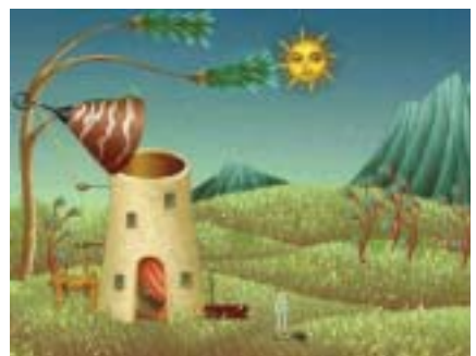
地球温暖化防止アニメーション「COCOFANTASY」