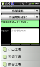
画面タッチによる メニュー選択

加えて、これらのサービス基盤上にお客様向け業務ソリューションを提供いたします。業務ソリューション適用においては、各種業務テンプレートをご用意いたします。(テンプレートの第一弾として、「保守点検業務支援」を2011年度第一四半期にリリース予定)