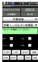
点検時の気づき入 力(メモ、カメラ等)