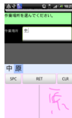
手書き文字認識に よる自由文入力

ハード基盤から業務テンプレートまでを一連のサービスとしてご利用いただくことにより、お客様は早期かつ安価にスマートフォン環境下で業務システムを活用していただけます。