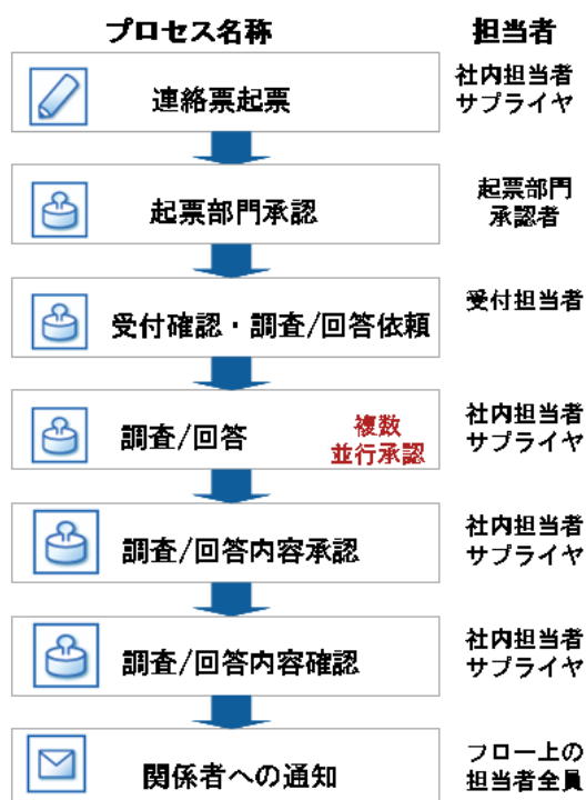
Documal SaaS「取引先テンプレート」(連絡票)画面例