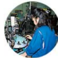
Xスタンパー組立ライン