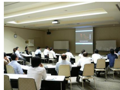
映画を鑑賞。リーダーについて考えます