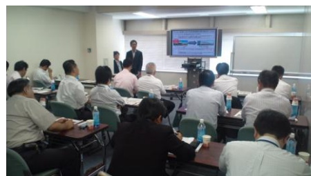
長崎のセミナーの様子です

「事業継続」の関連セミナーとして富士通が主催した「 事業継続対策セミナー 」にも協賛しました。上記の「事業継続」セミナーを補完する具体的なソリューションを解説した内容もありました。