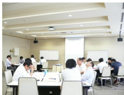
グループ演習です。いろいろ考えています。