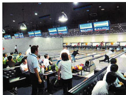
大分の親睦ボウリング大会の様子