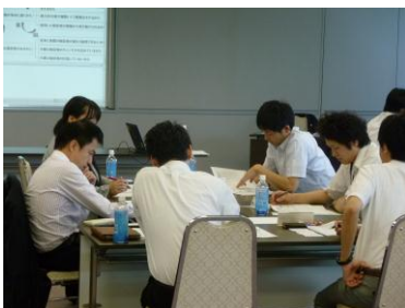
各グループでテーマについて検討しています。