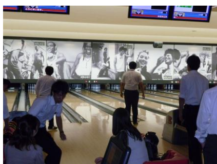
佐賀の親睦ボウリング大会の様子