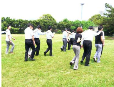
屋外での演習(ブラインドウォーク)をしました。