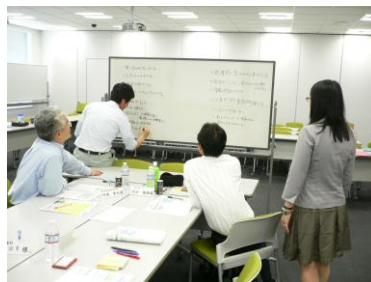
検討内容を書き出しています。