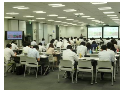
みなさん真剣に取り組まれています。