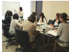
委員会での討議風景