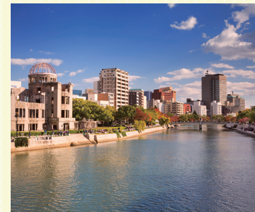
ひろしまリパークルーズ