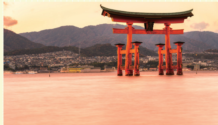
世界遺産・厳島神社