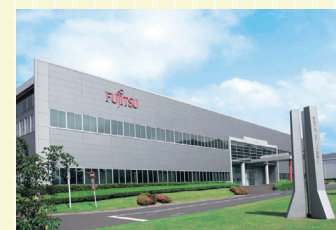
株式会社島根富士通