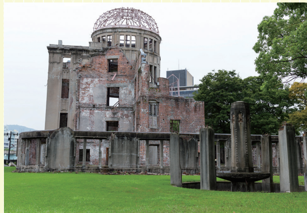
世界遺産・原爆ドーム