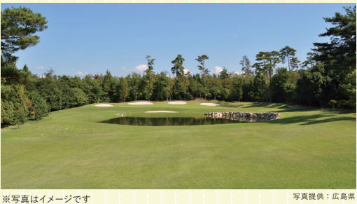
※写真はイメージです