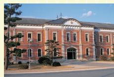
海上自衛隊第一術科学校