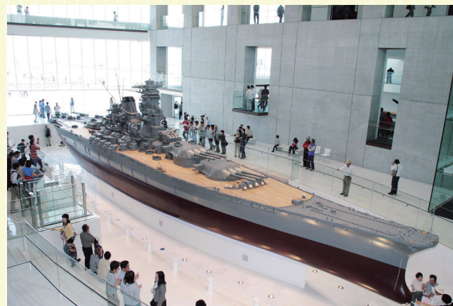
大和ミュージアム