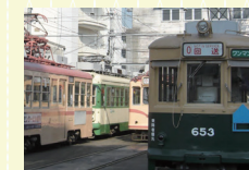
広島電鉄千田車庫